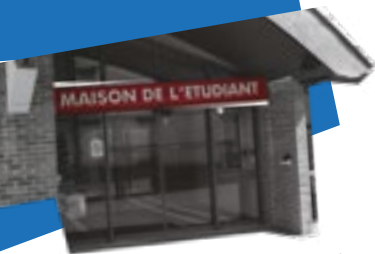
MAISON DE L'ÉTUDIANT Bâtiment M

À Arras, plusieurs espaces vous sont dédiés pour des activités culturelles et associatives.