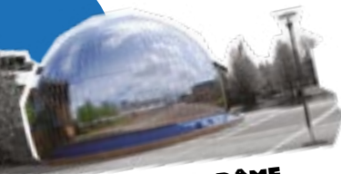
GALERIE DU DÔME Bâtiment K

→ La Ruche , laboratoire culturel de l'université et lieu de rencontres, d'échanges, de spectacles, de projections, d'expérimentations et de créations entre professionnels des arts et amateurs, ouvert sur la cité.